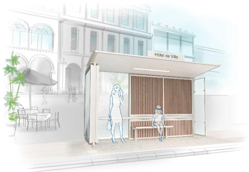
L'abri Fraîcheur Naturelle : fonctionnel et esthétique